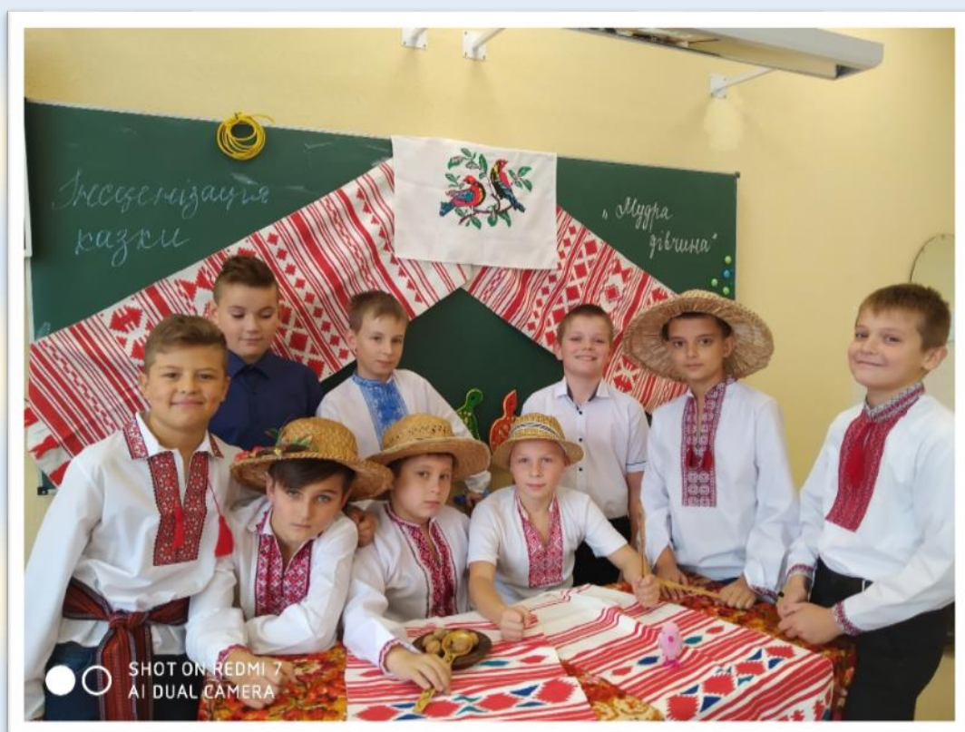
Фото 3-4. Інсценізація народної казки «Мудра дівчина».