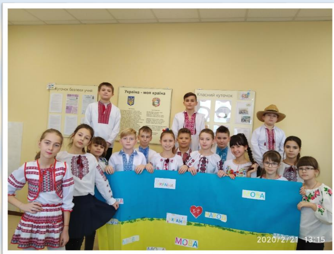
Фото 13-14. Флешмоб «Державні символи України»