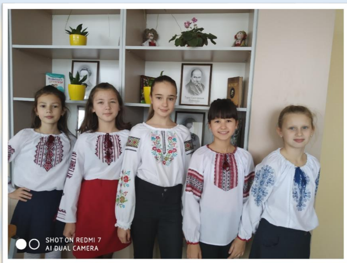
Фото 7-8. Мовно-літературне свято «Рідне слово».