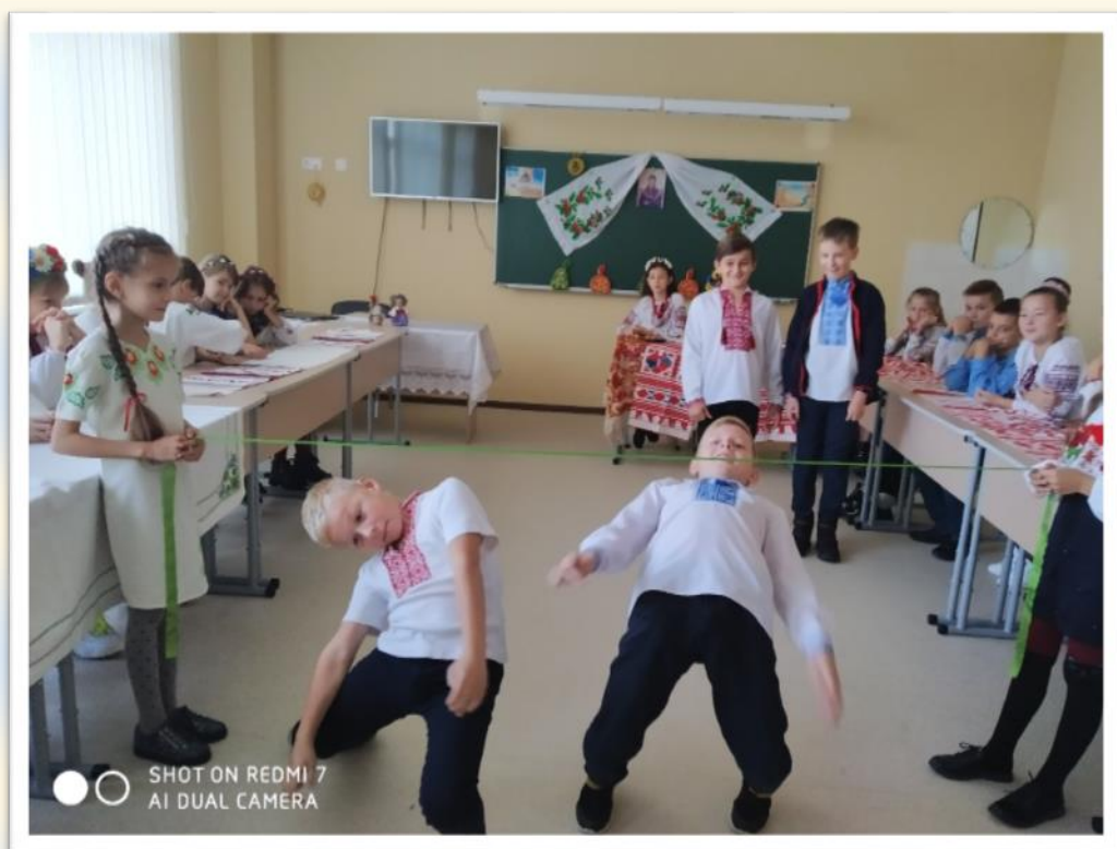
Фото 5. Лицарський турнір до Дня захисника Вітчизни.