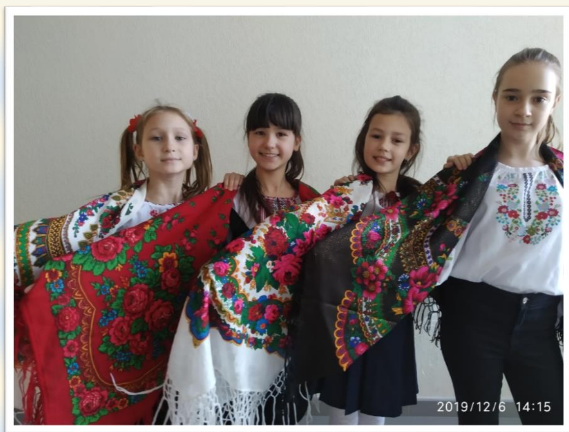
Фото 11-12. Флешмоб до Дня української хустки.