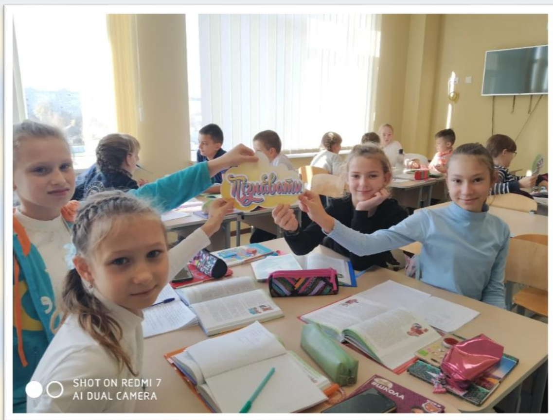
Фото 6. Укладання «Довідничка мудрих порад».